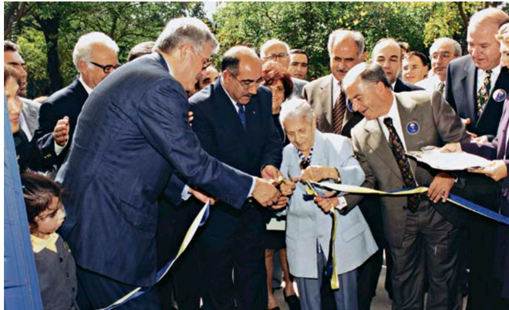
Erenköy Işık İlköğretim Okulu açılış töreni 11 Eylül 2000

Paris'in en şık caddelerinden birine, bence birincisine, adı verilen Michel de Montaigne (26 Şubat 1533-13 Eylül 1592), başyapıtı "Les Essais" Denemeler için "Ben kitabımı yaptığım kadar da kitabım beni yaptı." demiş. Hukuk okumasına karşın, felsefe ve edebiyatta