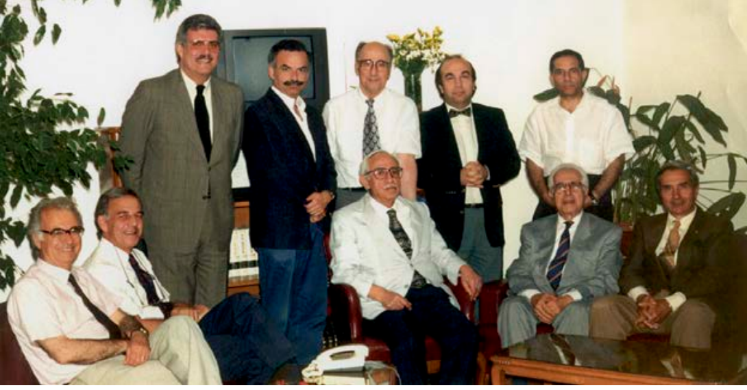
Fezziye Mektepleri Vakfı Yönetim Kurulu 1996

te, buna mukabil görevlerini ihmal edenlerin veya hiç yapmayanların adları dahi duyulmamaktadır. Üretmek için önce bilgi ve iyi niyet, sonra da gayret gerekmektedir. Zamanımızda bunlara dayanışma ve paylaşmayı da mutlaka eklemeliyiz.