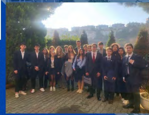
MEFHIGHMUN '25 ÖDÜLLERİMİZ

FMV Ayazağa Işık Lisesi ve Fen Lisesi öğrencilerinden oluşan MUN Kulübü, 10-12 Ocak 2025 tarihlerinde MEF Okullarında gerçekleşen "MEFHIGHMUN'25 Konferansı"na katılmıştır.