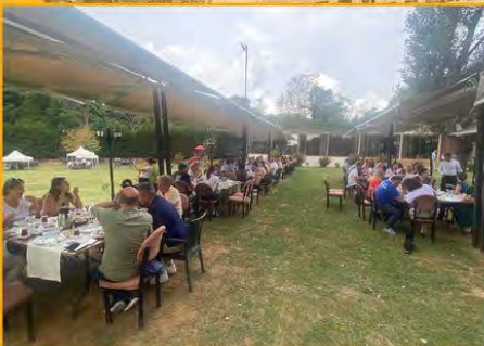
ÖĞRETMEN ORYANTASYON GEZİSİ 2024-2025 EĞİTİM ÖĞRETİM YILI 28 AGUSTOS 2024