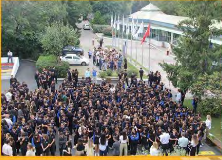
AYAZAĞA YERLEŞKESİ DEPREM TATBİKATI 19 Eylül 2024

FMV Ayazağa Işık Okulları, anaokulundan liseye eş zamanlı olarak tüm düzey öğrencileri ve öğretmenleri ile 19 Eylül 2024 Perşembe günü başarılı bir deprem tahliye tatbikatı gerçekleştirmiştiir.