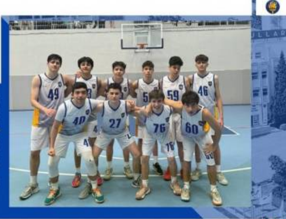
BASKETBOL GENÇ ERKEKLER TAKIMIMIZ SARIYER İLÇE BİRİNCİLİĞİ FİNALİNDE