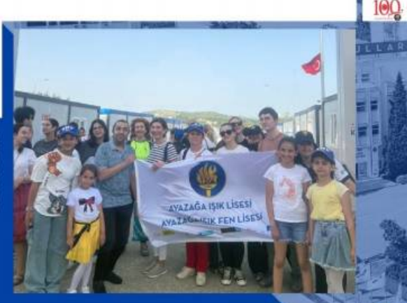
ÖĞRENCİLERİMİZİN HATAY'DAKİ KARDEŞLERİYLE "23 NİSAN ULUSAL EGEMENLİK VE ÇOCUK BAYRAMI" KUTLAMASI