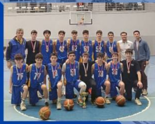
GENÇ ERKEKLER BASKETBOL TAKIMIMIZ İLÇE ŞAMPİYONU