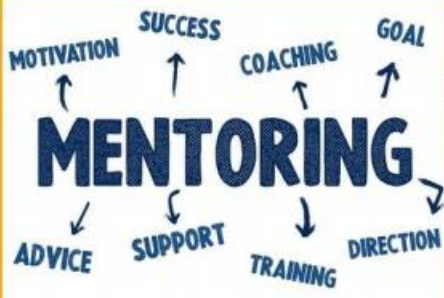
ÖĞRENCİ MENTÖRLÜĞÜ PROGRAMI 26-30 NİSAN 2024

FMV Ayazağa Işık Lisesi ve Fen Lisesi 11. sınıf öğrencileri; üniversite hazırlık süreçlerine yönelik olarak "Öğrenci Mentörlüğü Programı" kapsamında Advanced Placement (AP) dersleri üzerine 26-30 Nisan 2024 tarihleri arasında ilgili ders sınavlarına yönelik olarak çalışmalar düzenlemiştir.